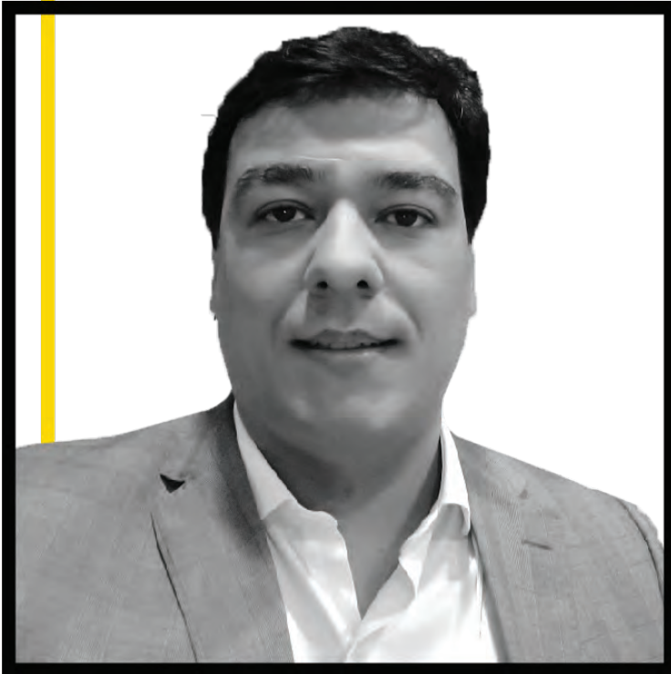
Account Manager especializado em Governo e CyberSecurity, região de Brasília

Para que as condições dos itens acima descritos possam dar certo, é necessário que este departamento faça a adequação, atualizando o modelo, regras e contrato de trabalho. Políticas de acesso e permissões, de forma que haja clareza nas cláusulas que se remetem à utilização das informações da empresa.